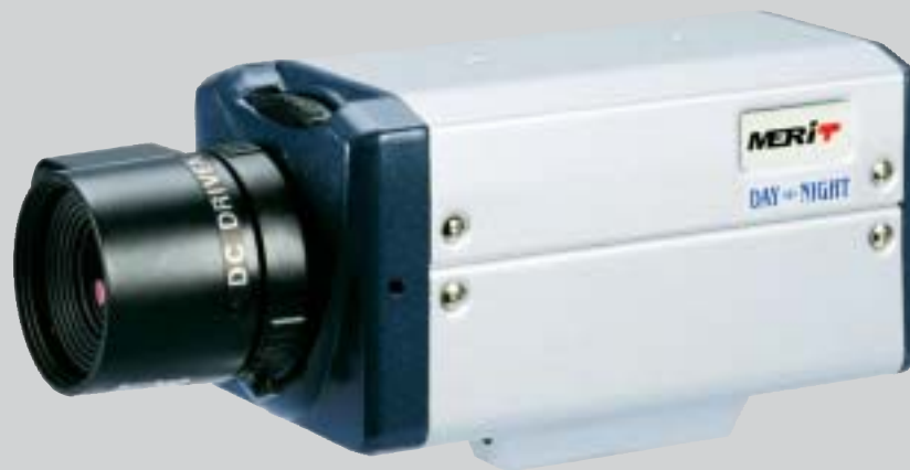
レンズは別売です